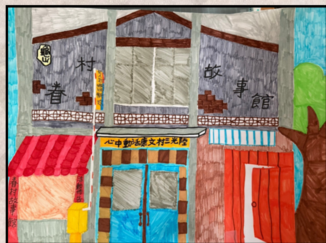
暑假作業〈畫我龜山〉 學生繪製眷村故事館