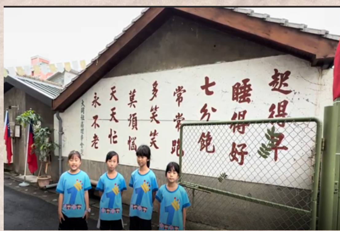
擔任小記者介紹憲光二村的特色