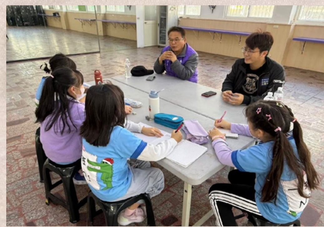
訪談里長及村長蒐集眷村故事與回憶