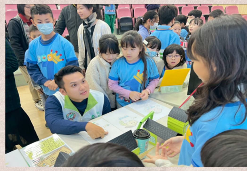
向議員導覽介紹我們製作的眷村風貌