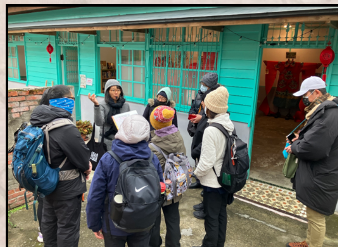
從參與走讀龜山研習 了解憲光二村的故事