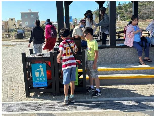
▲澎湖著名的「摩西分海」景點，沙灘上滿滿的海廢我們一人一手撿起瓶罐來分類、還給大海乾淨。