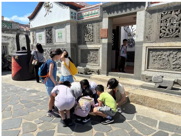
▲澎湖二崁古厝文化保留園區水溝蓋上滿滿菸蒂，其他同學看到我和隊員在撿菸蒂，大家也來幫忙。