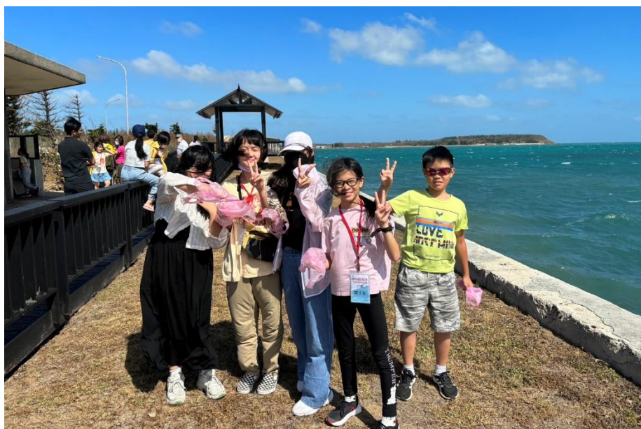
▲左圖是我和其他再見菸地隊員在澎湖「中屯風車」景點一起撿菸留念。因為我們沒有夾子和手套等工具，我們將早餐的塑膠袋留下來當手套使用、重複利用！